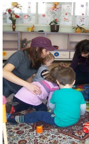
Цвети с деца от ОДЗ „Пчелица“

център за местната общност; - Детското отделение на МБАЛ - Търговище, където най-малките пациенти получават здравна грижа и емоционална подкрепа. - Детската яслена група към ОДЗ „Пчелица“, където малките „пчелички” опознават света.