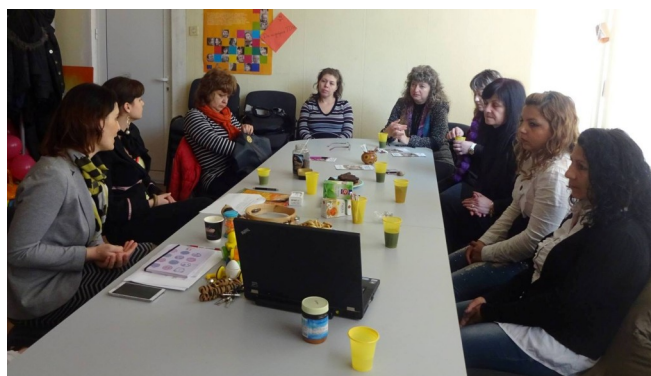
ПРЕДСТАВИХМЕ ПЪТУВАЩА БИБЛИОТЕКА НА ИГРАЧКИТЕ – 2 ПРЕД СПЕЦИАЛИСТИ И РОДИТЕЛИ

Двете програми са част от подхода Element of Play® на Worldwide Orphans Foundation (WWO). Той представлява съвкупност от интегрирани програми,