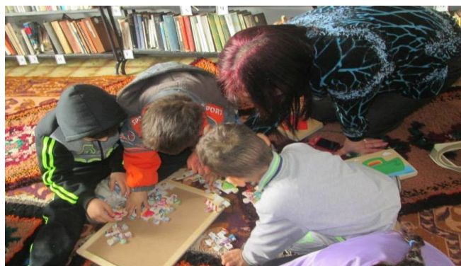
Деца от с. Давидово играят с играчки от пътуващата библиотека

развитие и връзката родител-дете чрез структурирани игрови сесии.