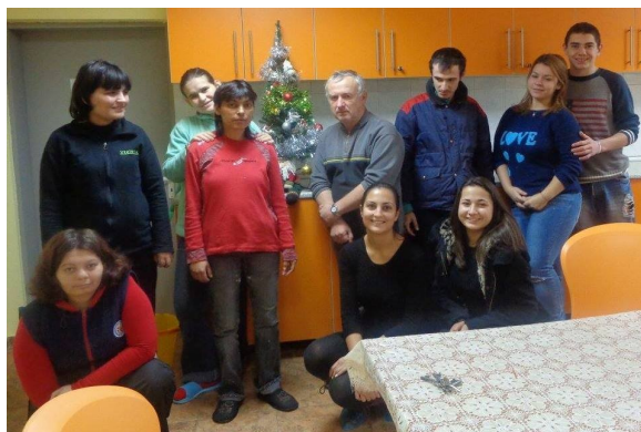
Момент от посещението ни в Комплекса за психично - здравни грижи в кв. Бряг

Нова година – нова организация, и то младежка ! Част от младежите възобновяват сдружение “Граждански Форум за Младежта!” С променен състав и с променен устав- вече са налице някои