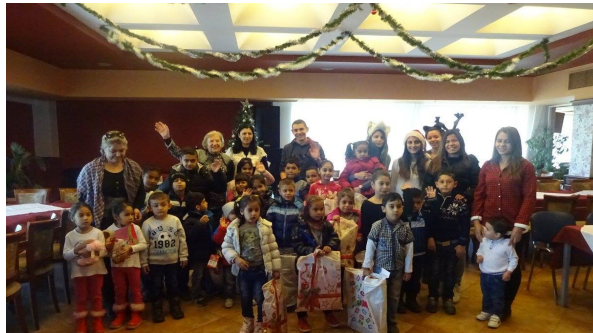
Благодарение на инициативата „Ангелската елха” деца от кв. „Малчо Малчев” получиха красиви Коледни подаръци от „Лайънс Клуб” – София

годарение на която деца от търговищкия квартал „Малчо Малчев” получават весело тържество и подаръци за новогодишните празници, осигурени от „Лайънс Клуб” – София.