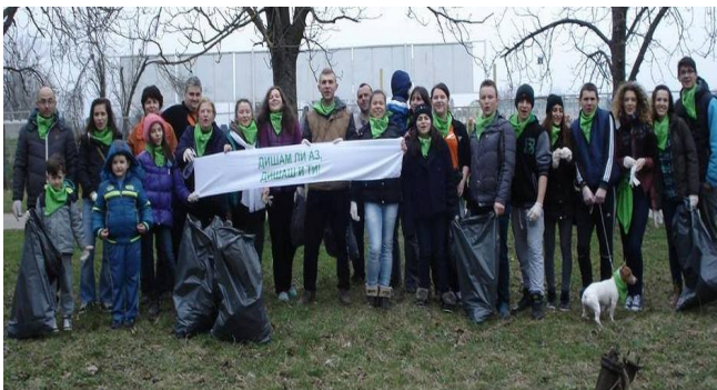
Над 200 търговищенци се включиха в кампанията по почистване на местността „Борово око” край града

Проектът „Екогерой” – за опазване на околната среда, в която участваха още доброволци от БМЧК- Търговище, както и много наши съграждани;