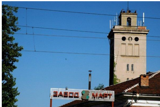
Водна кула – завод „8-ми март“