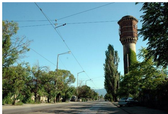
Водна кула „Илиянци“

А иначе в София са останали малко водни кули, но всичките изглеждат мистично. Някои от тях са с много привлекателен външен вид. Похвални са намеренията на район „Лозенец“ и СО да предприемат действия в посока на социализирането на една от тях. Дано скоро същата съдба последва и за останалите.