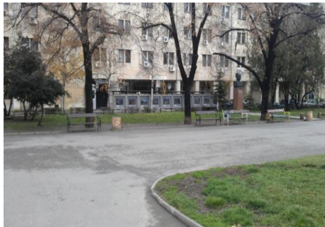
Градинката с мястото на паметника

Не знаем за вас, но за нас поставянето на паметник на българския полицай/милиционер в компанията на репресираните земеделци (Димитър Гичев и Г.М. Димитров) и точно до бюста на арестувания от същите тези милиционери и обесен през 1947 г. Никола Петков е меко казано проява на лош вкус.