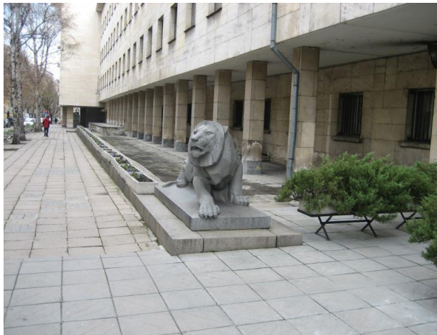
Територията пред МВР

Самата символика на проекта, спечелил конкурса, напомня повече стилистиката от преди 40 – 50 години. За тези, които не са виждали за какво става въпрос прилагаме снимки на спечелили I-во, II-ро и III-то място в конкурса проекти. 18