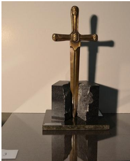
Второ място - проект с автор Марко Боттеро