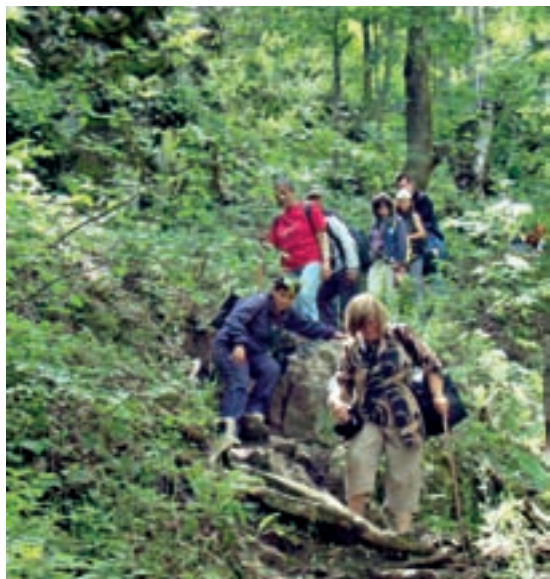
□ ЗДРАВ ДУХ В ЗДРАВО ТЯЛО – ЕКИПЪТ И ПАЦИЕНТИТЕ РЕДОВНО ПРАВЯТ ПОХОДИ, УЧАСТВАТ В ОБЩИНСКИ РАБОТНИЧЕСКИ ИГРИ, ХОДЯТ НА ФИТНЕС

вуването и на други услуги. Защитеното жилище за хора с психични проблеми, създадено през 2011 г. и финансирано в продължение на година от фондовете на Европейския съюз, осъществява идеята хората с психични проблеми да живеят в общността като равноправни и пълноценни граждани, да имат свой дом, самостоятелен живот и да бъдат щастливи. След края на проекта логиката и необходимостта от съществуването на такава социална услуга, която е в синхрон с европейските тенденции за т.нар. деинституционализация, сочат, че издръжката трябва да се поеме от държавния бюджет. Но заради административни неуредици с общинската управа в Пазарджик вече трета година екипът на „Човеколюбие“ поддържа услугата само с доброволен труд.