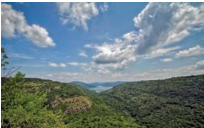
□ БЕЗ ДУМИ