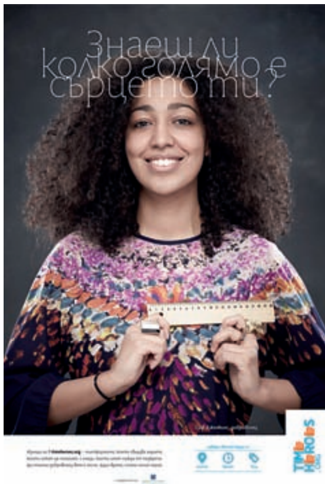
□ КАКТО ПОДОБАВА - ДОБРОВОЛЦИ УЧАТВАТ В РЕКЛАМНАТА КАМПАНИЯ НА TIMEHEROES