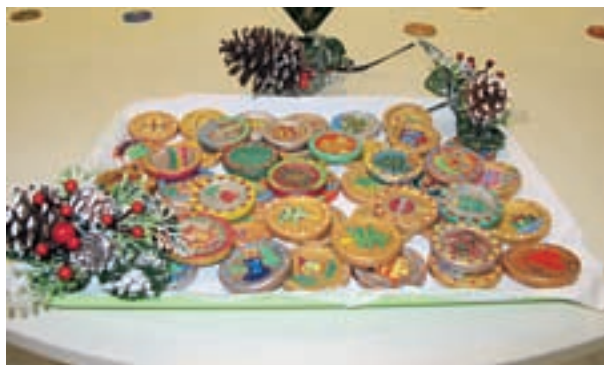
□ ВЪВ ВСЕКИ ВТОРИ ГАБРОВСКИ ДОМ ИМА ПОНЕ ЕДНО ДАРЧЕ - ГЛИНЕНА МОНЕТА, НАРИСУВАНА ОТ ДЕЦА, КОЯТО СЕ ВРЪЧВА НА ВСЕКИ ДАРИТЕЛ