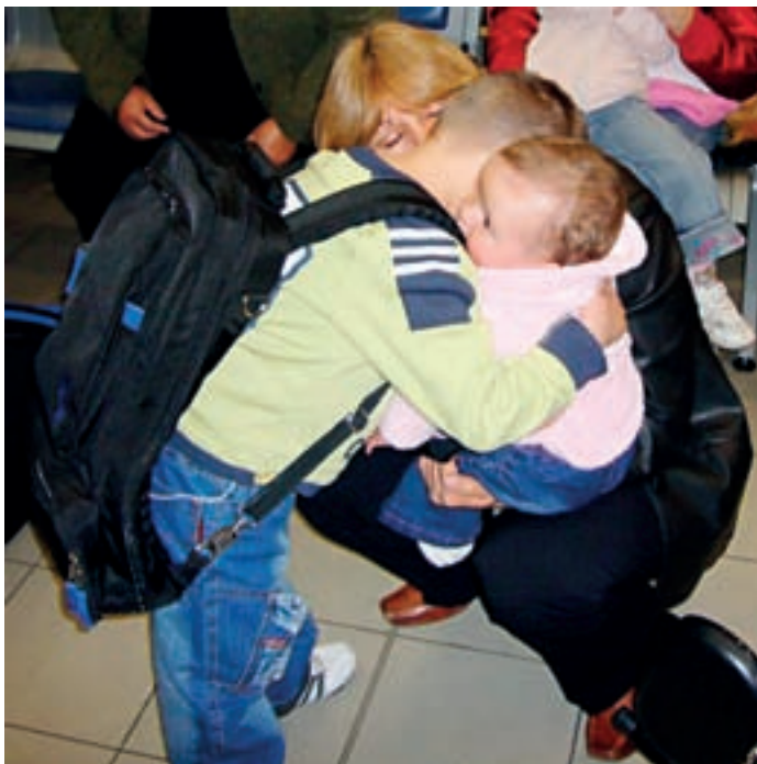
□ ГОШКО СЕ СБОУВА С БАБА СИ И МАЛКАТА СИ СЕСТРИЧКА, ПРЕДИ ДА ЗАМИНЕ ЗА ОПЕРАЦИЯ В БОСТЪН, САЩ