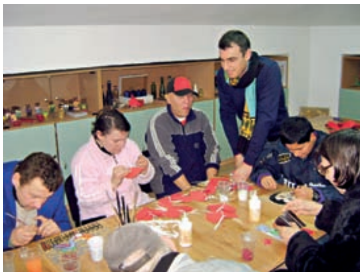
□ ПОСЕТИТЕЛИТЕ НА ЦЕНТЪРА САМИ ИЗРАБОТВАТ И ПРОДАВАТ МАРТЕНИЦИ ЗА БАБА МАРТА И СЪРЪЧИЦА ЗА СВЕТИ ВАЛЕНТИН

Тук думи като взаимомощ, честност и достойнство имат пълнокръвен смисъл, а топлата прегръдка е средство за общуване