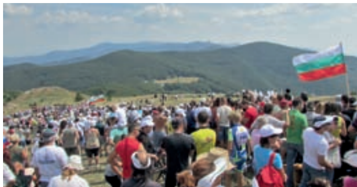
□ ЧЕСТВАНИЯТА НА ШИПЧЕНСКИТЕ БОЕВЕ СЪБИРАТ НАЙ-ГОЛЕМИ СУМИ ОТ ДАРИТЕЛИ, И ТО БЕЗ НИКОЙ ДА ОСИГУРЯВА НАСРЕЩНО ФИНАНСИРАНЕ