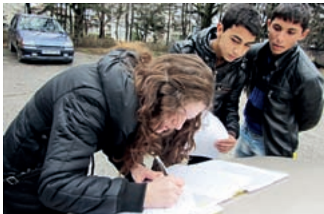
□ ПОДПИСВАНЕТО НА ДОГОВОРИТЕ С РОМИТЕ СТАВА НЕ ПРЕД ТЕЛЕВИЗИОННИ КАМЕРИ И ПОЗИРАЩИ ПОЛИТИЦИ, А НА ТЕРЕН – НА КАПАКА НА КОЛАТА НАПРИМЕР

максимално опростен формуляр от една страница (ехо, оперативните програми, чувате ли се?).