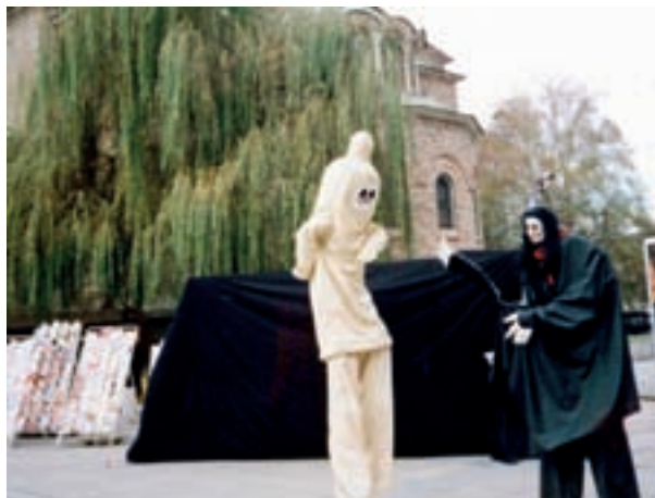
□ "ОПАСНА ЛЮБОВ" - УЛИЧНО КОКИЛНО ШОУ НА ТЕАТЪР "ЦВЕТЕ" В НАЦИОНАЛНИЯ ХЕПЪНИНГ В МЕЖДУНАРОДНИЯ ДЕН ЗА БОРБА С ХИВ И СПИН