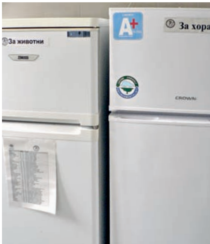
□ ТУК Е ТАКА

този единствен мигрираш вид сред лешоядите е много разпространен, но по редица причини, всички свързани човека, популацията му към днешна дата намалява със застрашителни темпове.