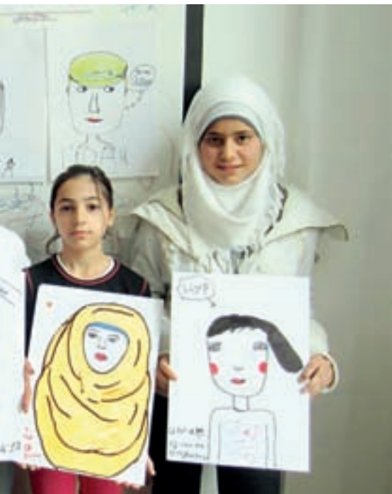
□ „ПОРТРЕТ РАБОТИЛНИЦА ЗА ДЕЦА“ - МИСИЯ, В КОЯТО ДЕЦА НА БЕЖАНЦИ И НА TEDX-ЪРИ СЕ ЗАПОЗНАВАТ И ОБЩУВАТ ЧРЕЗ ТВОРЧЕСКА ИГРА, РИСУВАЙКИ ПОРТРЕТИ ПОД МЕНТОРСТВОТО НА АРТИСТИ