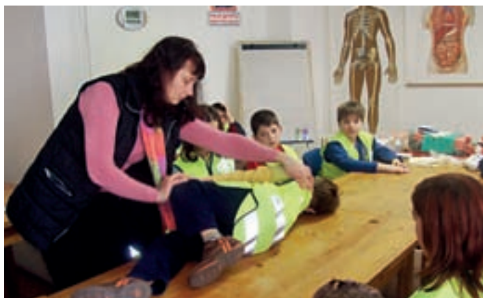
□ ДЕЦАТА НАУЧАВАТ КАК ДА СЕ СПРАВЯТ В КРИТИЧНИ СИТУАЦИИ