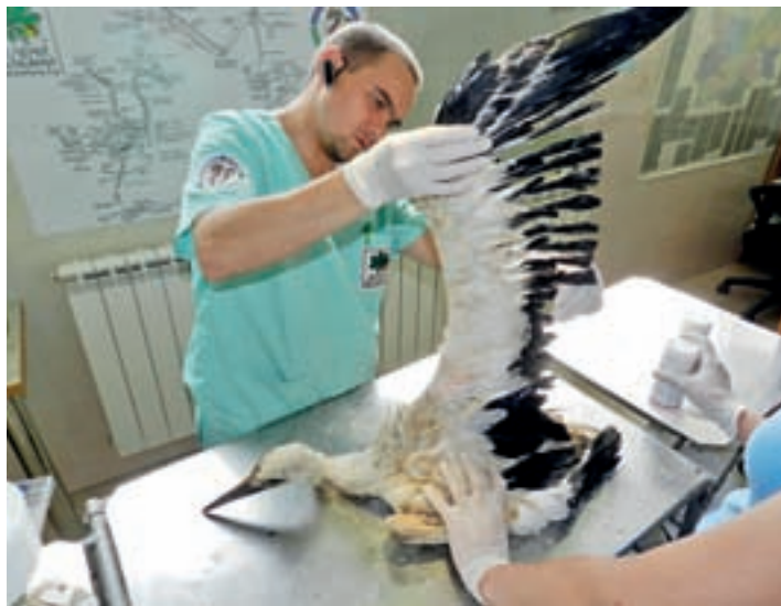
□ ПОВЕЧЕ ОТ 1500 ЖИВОТНИ МИНАВАТ ГОДИШНО ПРЕЗ ЦЕНТЪРА