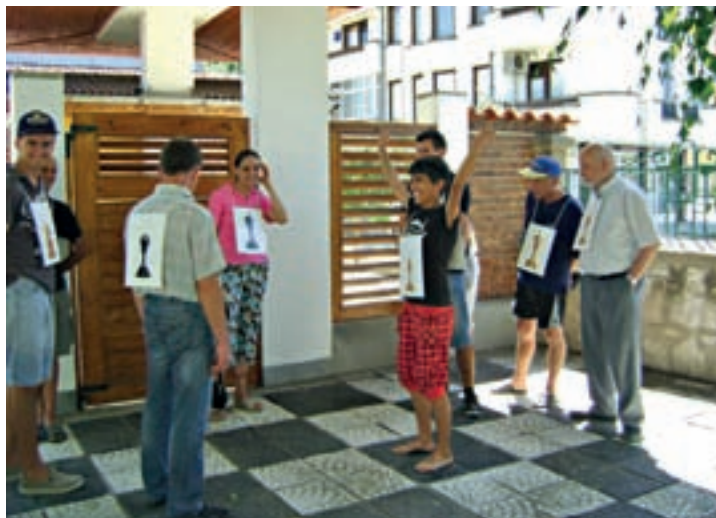
□ ШАХ С ЖИВИ ФИГУРИ – ПОСЕТИТЕЛИТЕ НА ЦЕНТЪРА ВЛИЗАТ В РОЛЯТА НА ШАХМАТНИ ФИГУРИ И ЗАЕДНО ОБСЪЖДАТ СТРАТЕГИЯТА НА СВОЯ ОТБОР