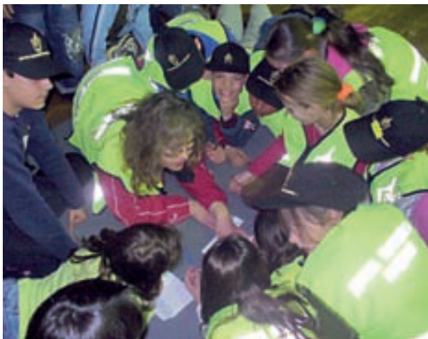
□ МАЛКИТЕ КАДЕТИ, ЗАВЪРШИЛИ АКАДЕМИЯТА, СА ПО-МАЛКО АГРЕСИВНИ И ПО-СКЛОННИ ДА ПОМАГАТ НА ХОРА В БЕДА