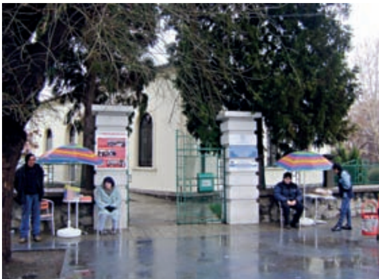
□ СГРАДАТА НА УЛ. „Д-Р ЛОНГ“ 12 В ПАЗАРДЖИК Е МЯСТО, КЪДЕТО МОЖЕ ДА ОТИДЕ ВСЯКА ИЗГУБЕНА ДУША - ДА СПОДЕЛИ, ДА ПОЛУЧИ ПОДКРЕПА, ДА ДАДЕ ПРЕДЛОЖЕНИЯ, ДА УЧАСТВА В ГЛАСУВАНИЯ