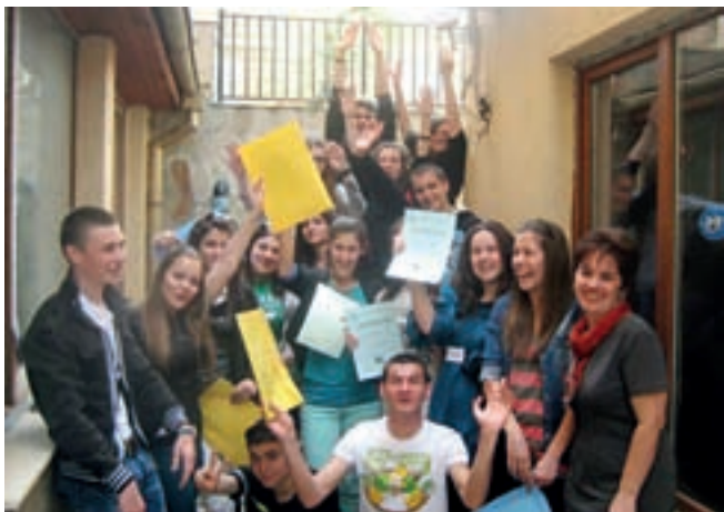
□ ЧАСТ ОТ ПРЕМИНАЛИТЕ ПРЕЗ АКАДЕМИЯТА МЛАДЕЖИ УЧАСТВАТ НА ДОБРОВОЛНИ НАЧАЛА В ДЕЙНОСТИТЕ НА СДРУЖЕНИЕТО, ВКЛЮЧИТЕЛНО КАТО МЕНТОРИ

„Деца възпроизвеждат житейския модел, който виждат и в който растат. Нашата надежда беше, че, показвайки им друг модел, ние ще им дадем шанс да променят живота си.“