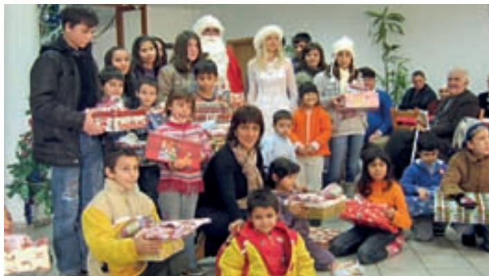
□ ЗА НЯКОИ ОТ ХОРАТА В РЕГИОНА ЕКИПЪТ НА „НОВ ПЪТ“ Е ЕДНОВРЕМЕННО РАБОТОДАТЕЛ, УЧИТЕЛ, ДОКТОР, ПАСТОР, ДЯДО КОЛЕДА...

как тези деца сграбчват кутиите и ги разкъсват и после - погледите им, като намерят лакомствата... А някои от тях получават обувки за пръв път в живота си... Изживяването е неописуемо.”