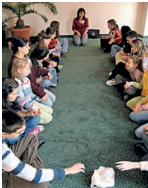
□ НЕФОРМАЛНО ГРАЖДАНСКО ОБРАЗОВАНИЕ НА ВРЪСТНИЦИ ОТ ВРЪСТНИЦИ. ЗАПОЧНАЛО ПО ПРОЕКТ НА ТЕАТЪР „ЦВЕТЕ“ ОТ 2007 Г., ПРОДЪЛЖАВА И ДО ДНЕС