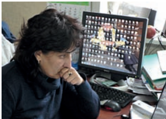
□ РАБОТНИЯ ПЛОТ НА ЕДИН МОНИТОР НЕ Е ДОСТАТЪЧЕН ЗА ПАПКИТЕ СЪС ЗАДАЧИ НА СПАСКА