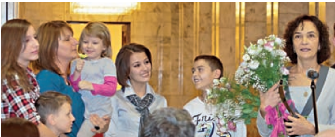
□ ЧАСТ ОТ ЕКИПА С ЧАСТ ОТ „ТЕХНИТЕ“ ДЕЦА

– „от подаването на заявлението за подкрепа до изпращането на детето на летището – всичко се случва във фонда“, обяснява тя. Споделя, че в момента институцията работи добре, макар да не липсват стресовите ситуации.