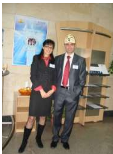
С поглед към следващото учение