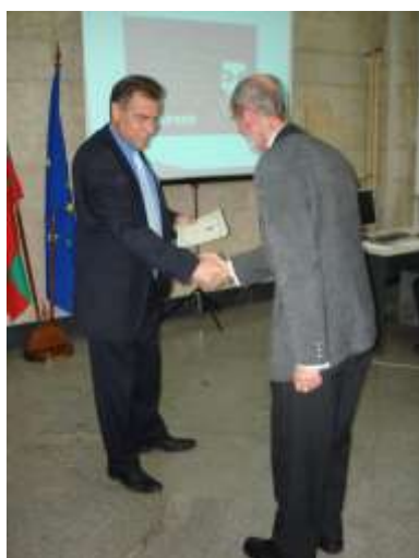
Благодарности към екипа...