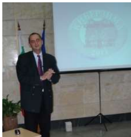
Първи анализи и поуки...