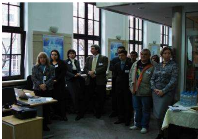
Участници от II-ро функционално ниво (технически експерти)