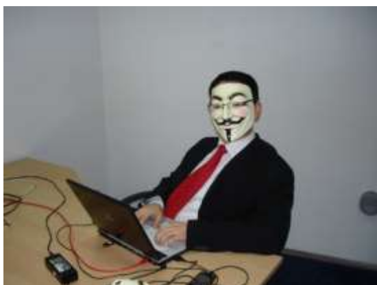
Един от нашите „бели хакери“ ...

Като заключение може да се каже, че учението беше интересно съчетание на „сериозност“ и „забавление“, което е и една от целите на „сериозните игри“ – да придобиваме компетенции неусетно и с удоволствие!