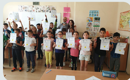
Обучение на деца по проект на „Виа Хуманика“