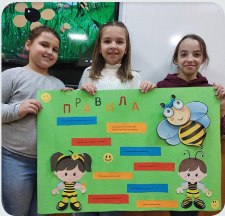
Обучение на деца по проект на „Знание“ – Ловеч