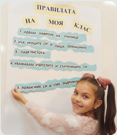
Обучение на деца по проект на „Знание“ – Ловеч