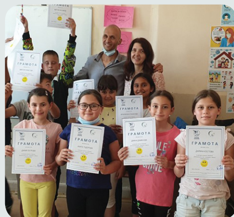
Обучение на ученици по проект на „Виа Хуманика“