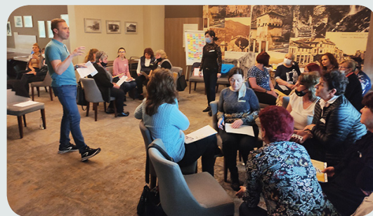
Обучение на читалищни работници, проект на Народно читалище „Фар“