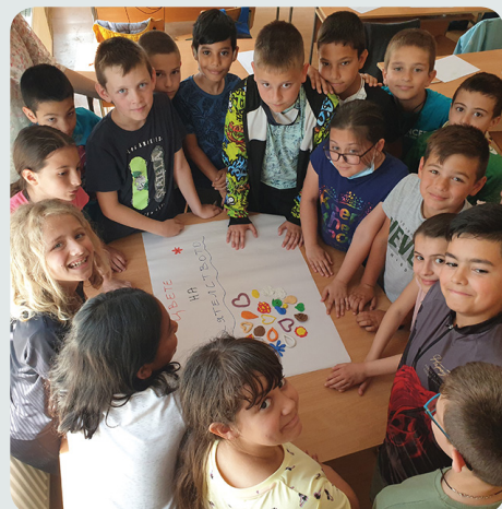
Обучение на ученици по проект на „Виа Хуманика“