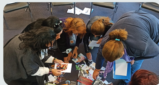
Обучение за учители, проект на „Зона Семейство“