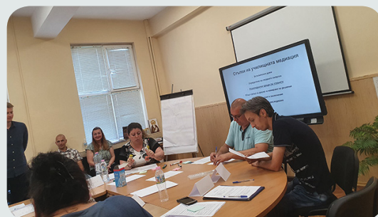
Обучение на учители, проект на „Виа Хуманика“