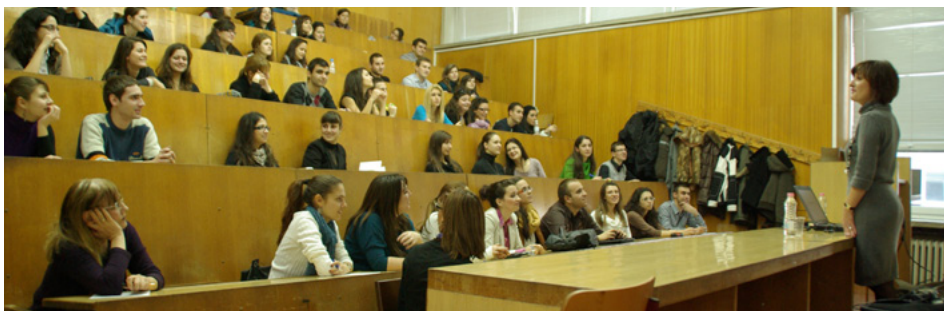
Лекцията събра около 70 студенти, които активно се включваха по време на дискусията.